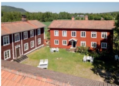
Till vänster ligger bostadshuset. Huset till höger är helt och hållet byggt för fest.

Släkten som ägt Gästgivars i flera generationer sålde gården för några år sedan. De nya ägarna är angelägna om att visa upp och berätta om världsarvet och anordnar visningar, evenemang och spelmanstämor. I den tidigare ladugården finns en restaurang och det finns också ett besökscentrum och en butik i den före detta stalllängan.