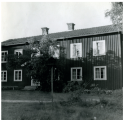
Gästgivars i Vallsta.

Varför de sju utvalda hälsingegårdarna hamnade på världsarvslistan förklaras bra av det engelska namnet för världsarvet Hälsingegårdar: Decorated Farmhouses of Hälsingland . Det är de välbevarade dekorerade rummen och interiörerna som Unesco menar är av "universellt värde" och det unika med husen. Husens väggmålningar, schablonmålningar och tapeter är det som bidrog till att just dessa sju hälsingegårdarna hamnade på världsarvslistan.