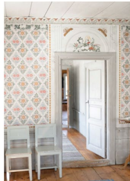
Gästgivars i Vallsta.

Idag finns fler än 1000 av dessa hälsingegårdar kvar, och i 400 finns fortfarande väggmålningar och äldre tryckta tapeter bevarade. Det här är en unik kulturskatt, så unik att sju av hälsingegårdarna har blivit världsarv.