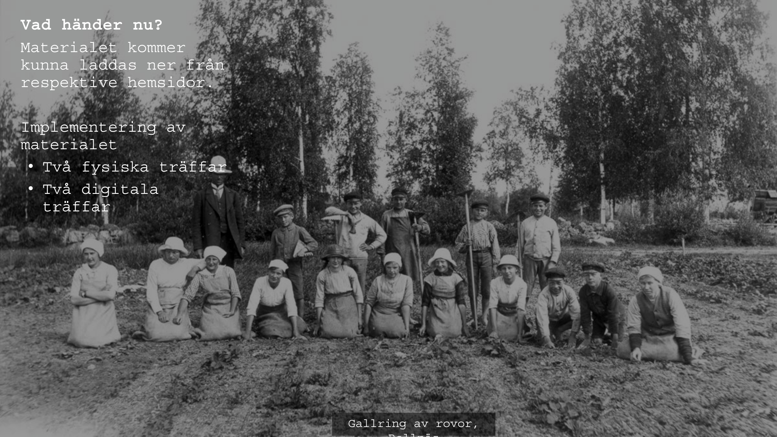
Gallring av rovor, Dollnäs